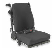
Rücken: ARH 2174, 2175