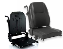
Rücken: ARH 2172 bzw. 2173